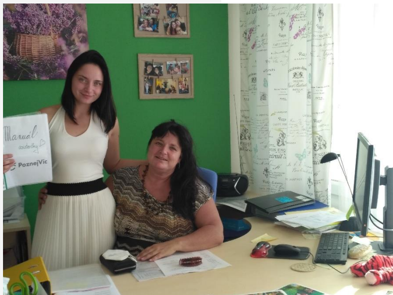
Práce personální a pedagogické asistentky dětské zájmové a zážitkové firmy Poznej Víci s.r.o.