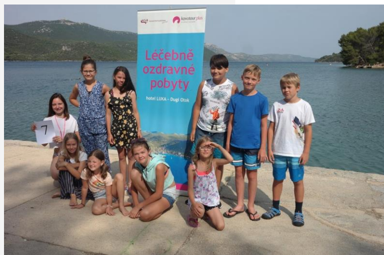
Vedoucí oddílu dětí ve věku 7–11 let na 3 týdenním ozdravném pobytu Mořského koníka