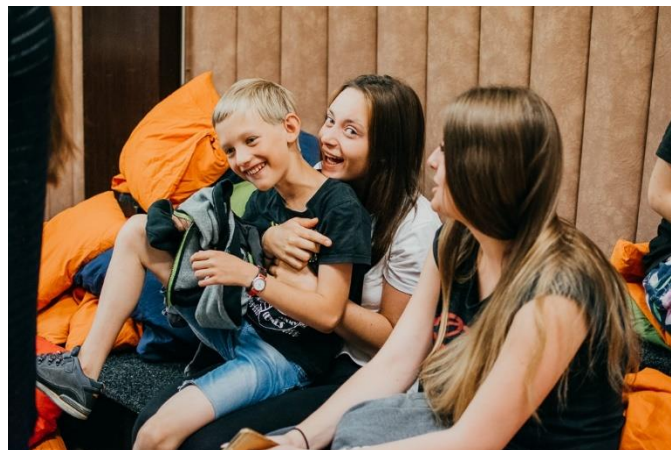
Práce s dětmi v předškolním věku a mladším školním věku, soukromé hlídání