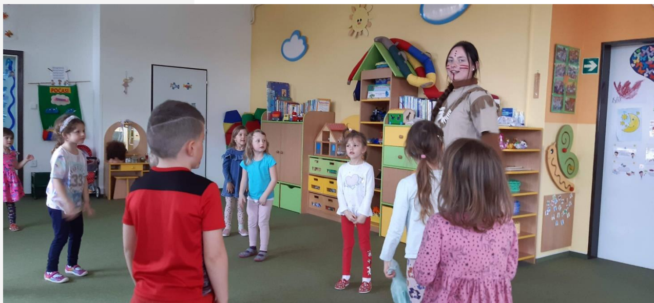
Dětské mimoškolní aktivity – kroužek tanečků v MŠ