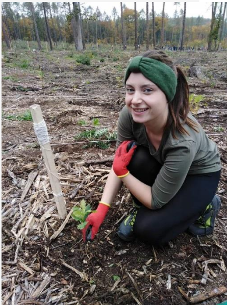
Praxe v arboretu a sázení semenáčků a sazenic