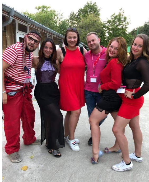
Spolupráce v týmu