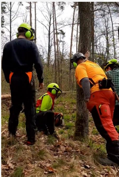
Práce s motorovou pilou