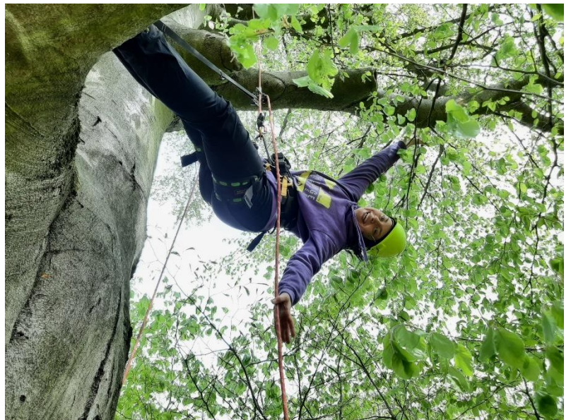
Stromolezení a arboristická praxe